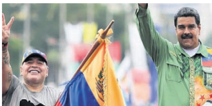
E dictador di Venezuela, Nicolas Maduro, a ricibi diamars na Caracas e ex-futbolis

ta Argentino, Diego Armando Maradona, kende tabata bishitando e pais petrolero pa duna ‘apoyo politico’ na e lider chavista.